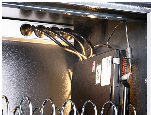
Skinne til strips til ledningsophæng

Med venlig hilsen SafeGroup teamet 86 27 37 44