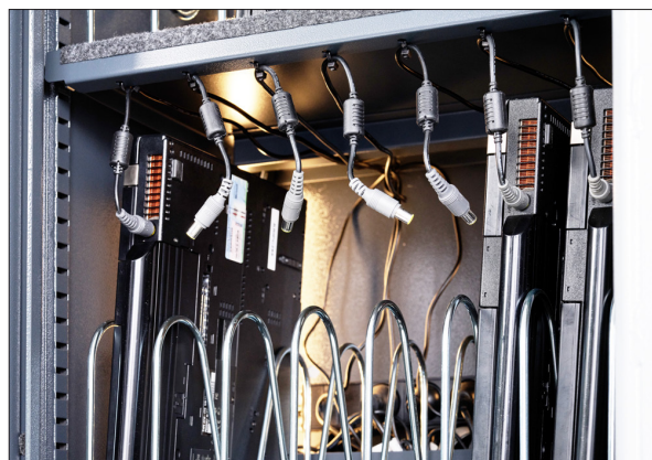
Underside af hylde med huller til strips til ledningsophæng